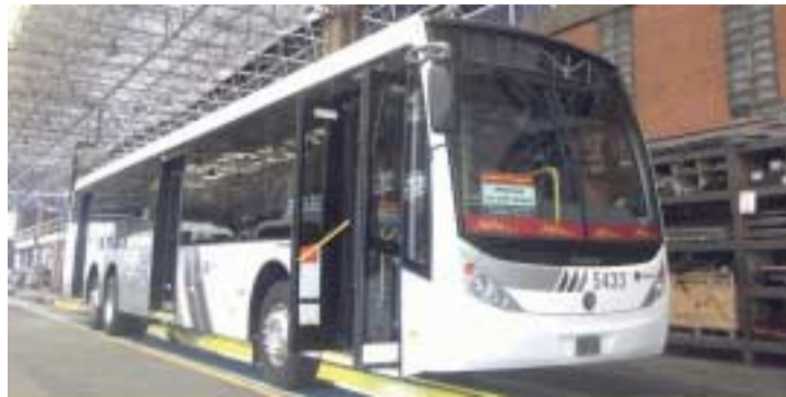
Veículos com quinze metros tem capacidade para 100 passageiros

A lotação dos novos ônibus pode ser de 100 pessoas contra aproximadamente 70 pessoas que eram transportadas no modelo antigo, que tinha 12,3 metros de comprimento. Mesmo sendo maiores, os ônibus de 15 metros proporcionalmente ocupam menos espaço nas vias comuns e