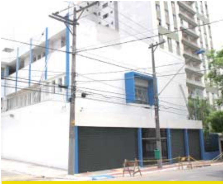
Velório na rua Rio Grande do Sul também passa a ser municipal