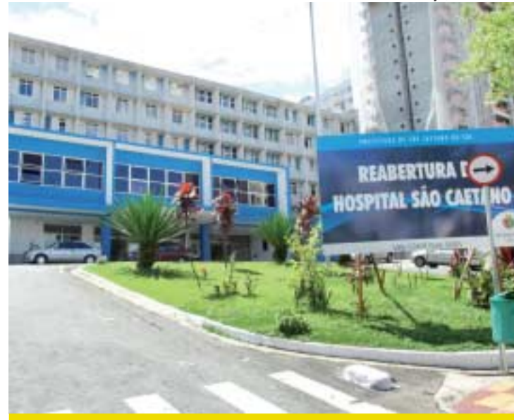
Prefeitura é depositária do Hospital por decisão da Justiça