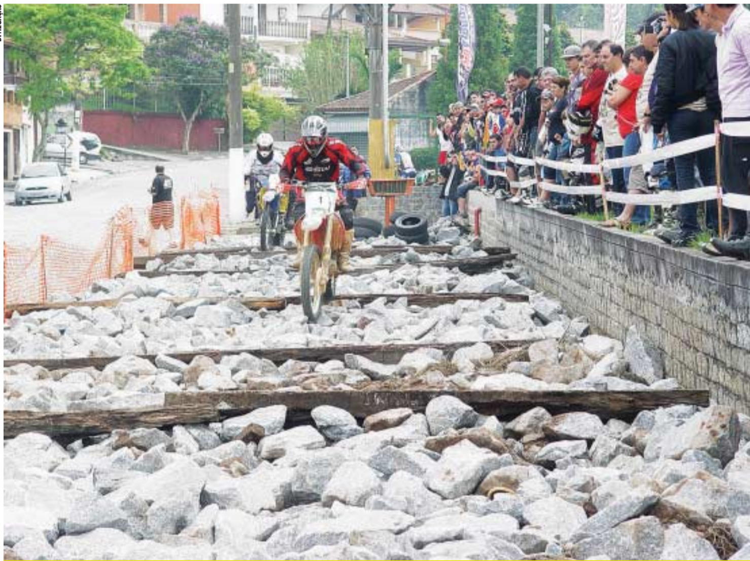
Obstáculos artificiais foram montados em algumas ruas para garantir a execução de manobras da etapa válida pelo Campeonato Paulista