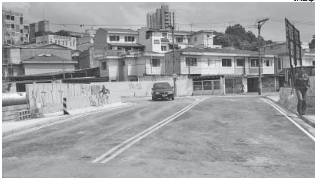
Ponte João Ducin é liberada para o trânsito, em tempo recorde, após 45 dias de obras