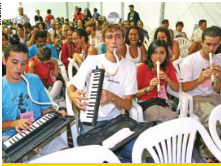
Reuniões tem o objetivo de estimular as atividades culturais da cidade