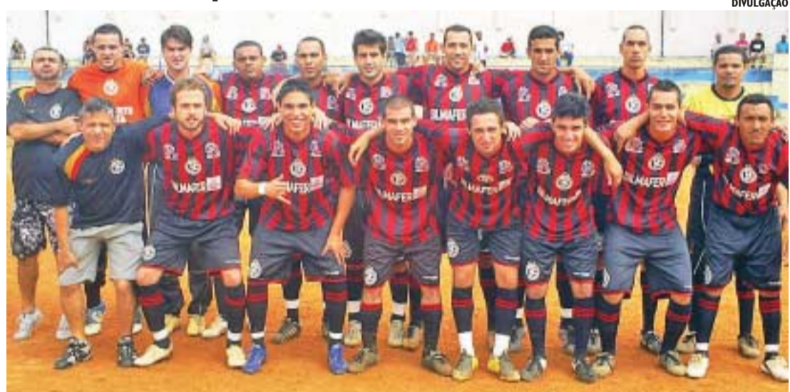
Equipe do Unidos da Vila São José garantiu à cidade pela segunda vez o título do tradicional torneio

Não poderia ser diferente no duelo entre dois clubes com potencial equivalente, em que um tinha o melhor ataque e outro a melhor defesa. Numa emocionante partida, decidida somente nos pên-