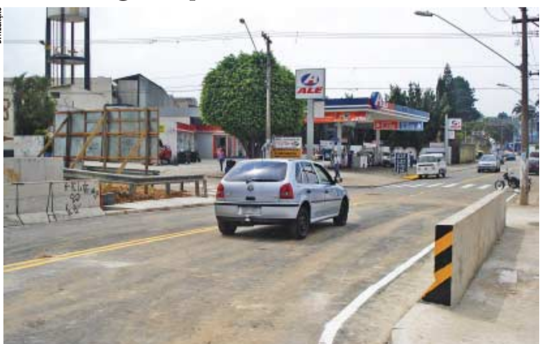
Veículos já puderam trafegar pela ponte, que foi reconstruída após as chuvas de fevereiro

A ponte da avenida João Ducin, foi liberada ontem para o tráfego de veículos após 45 dias de obras. A ponte ruiu no mês de fevereiro devido as fortes