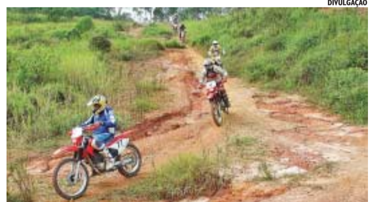
Evento reuniu 200 motociclistas no último final de semana

O campeão da categoria elite, a principal da competição, foi