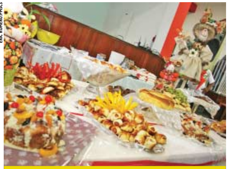
Os moradores do Santa Maria participaram do curso de panificação