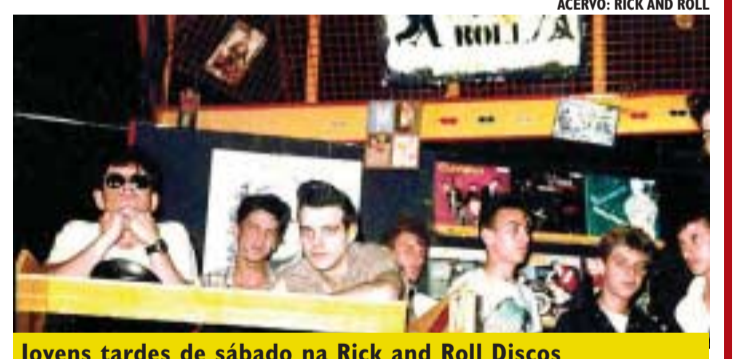
Jovens tardes de sábado na Rick and Roll Discos

Entretanto o que também levou São Caetano ser com-